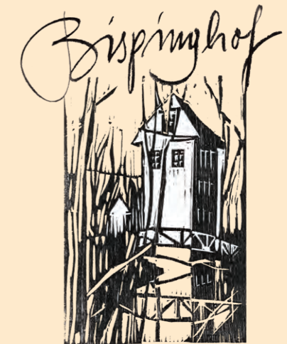
Förderverein Bispinghof e.V.